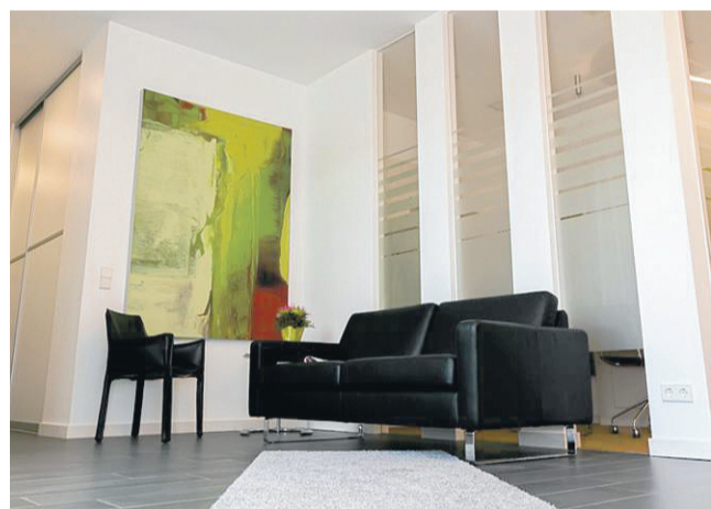
Die Gemeinschaftspraxis ist hell, freundlich und lichtdurchflutet.