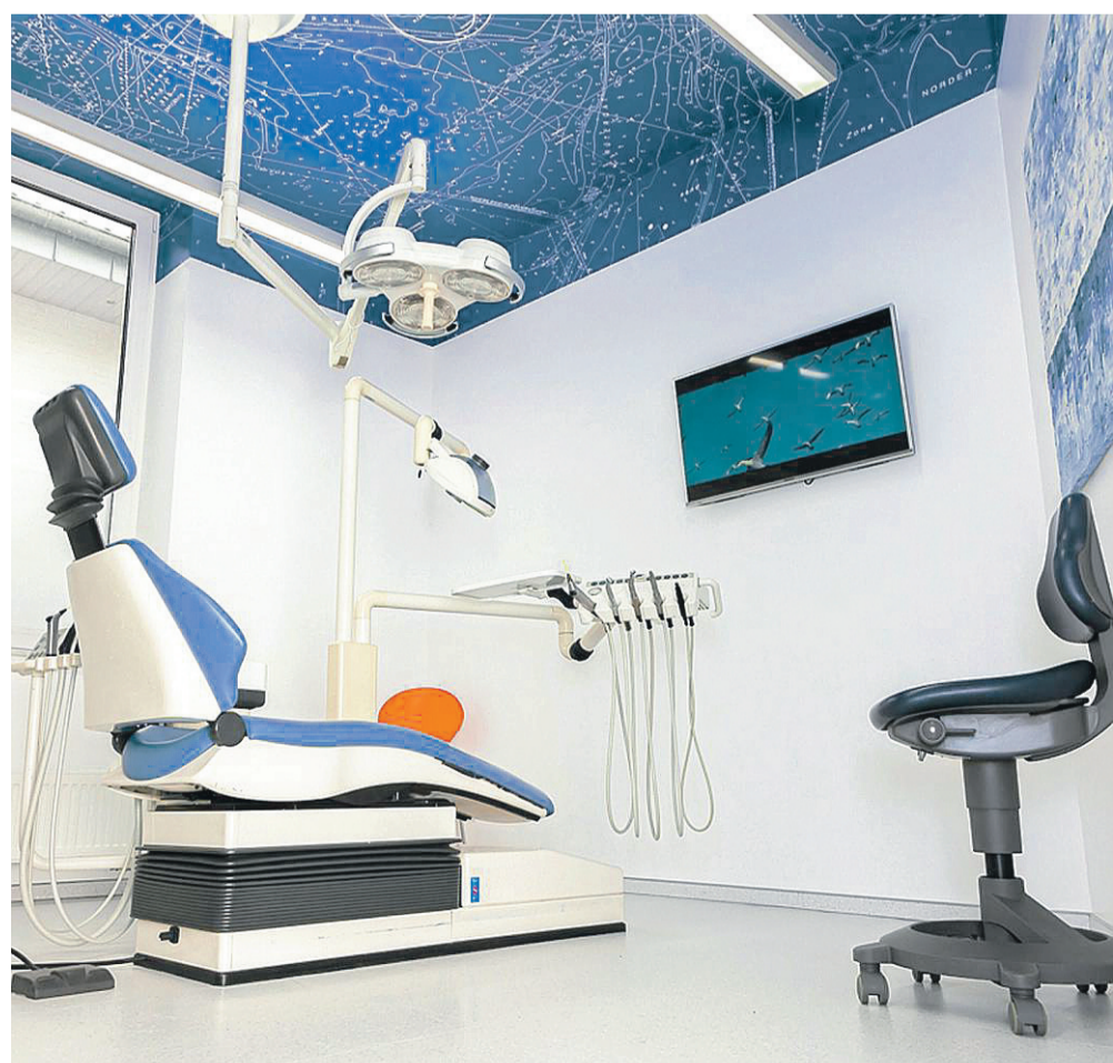
Die neuen Behandlungsräume wurden mit Seekarten an der Decke ausgestattet – hier ist die Insel Norderney zu sehen.

Dülmener Straße 18 a · 48653 Coesfeld Telefon: 025 41 / 853 44 · E-Mail: kohl-heers@t-online.de www.kohl-heers.de